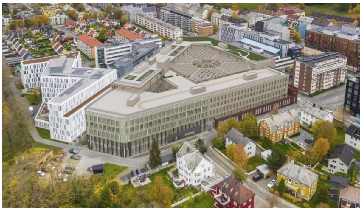
Figur 2 Slik vil Teknostallen se ut når det står ferdig sett mot nord.

I tillegg til den store hagen innvendig så skal det på taket bygges Trondheims største takhage. Det blir også anlagt en løpebane og oppholdsareal som kan brukes når klimaet tillater det.