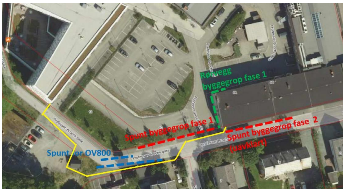
Figur 3 Omfang spunt i fase 1.